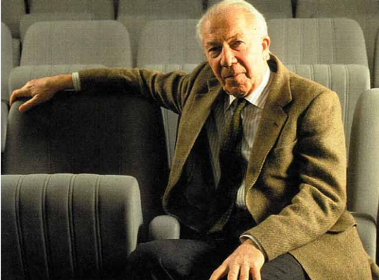
Semanario Solidarité No. 38, 20 de septiembre de 2006.

“El diseño inteligente no es nada nuevo. Sólo es una palabra nueva. La teoría del diseño inteligente ha sido defendida desde hace ya doscientos años. En aquella época se llamaba finalismo, que se emparentaba con el vitalismo.”